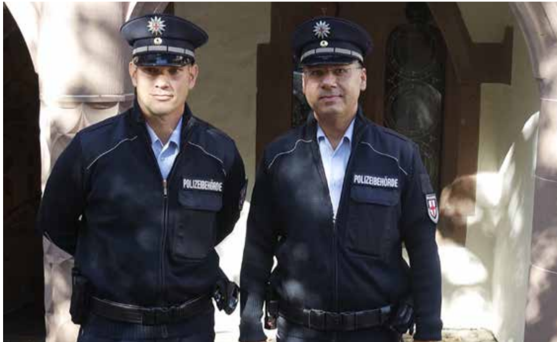
Kommunaler Vollzugsdienst, (Foto: rdl.de, Lizenz: CC Attribution, non-Commercial, Share Alike)

Hans-Bunte-Areal. Schon die Einführung der SIPA war als Reaktion auf den Mord an Maria L. an der Dreisam verkauft worden, obwohl