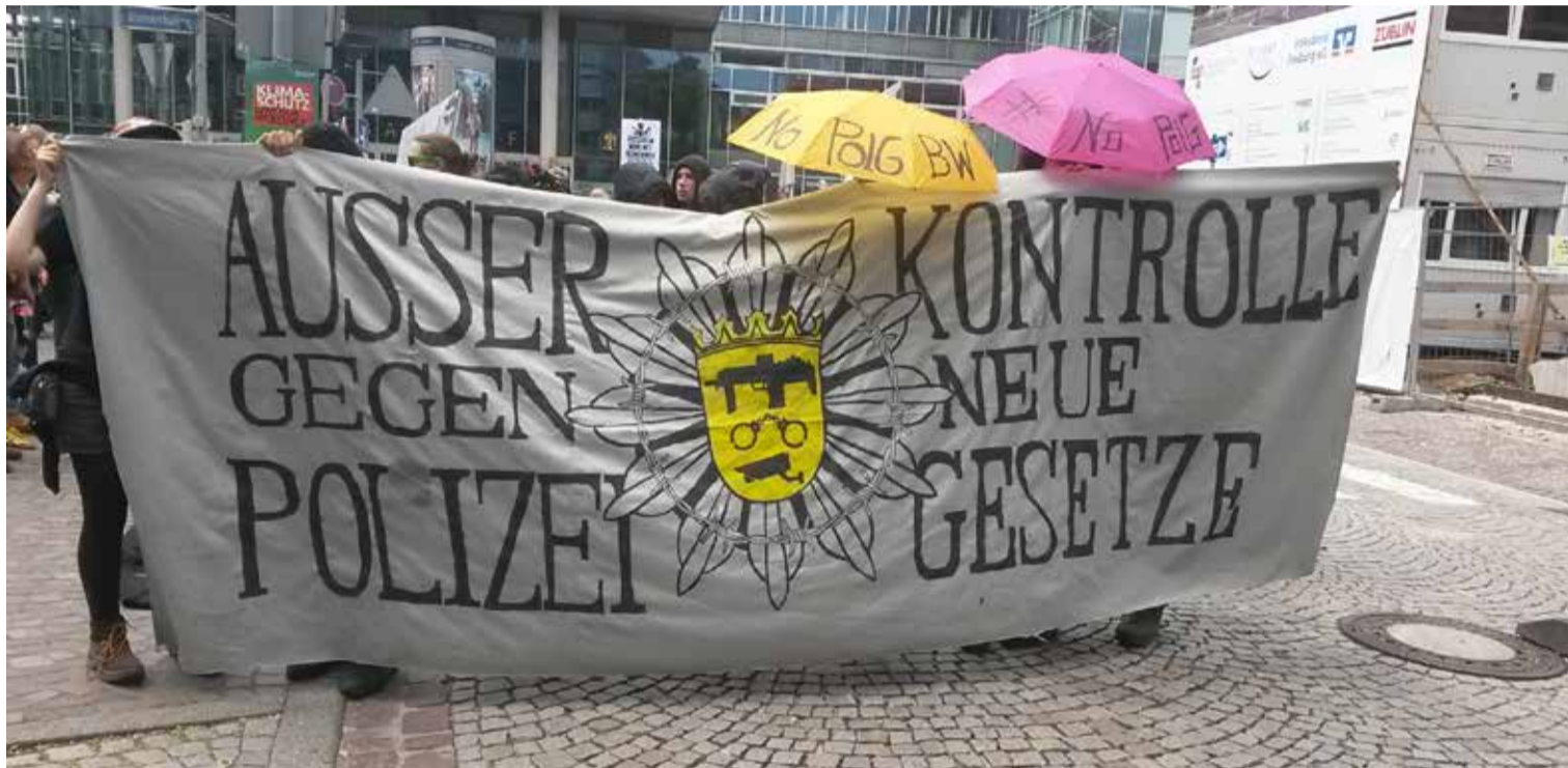
Demonstration gegen die Polizeigesetze in Freiburg

Klar ist auch, dass Freiheit und Sicherheit als Gegensätze in jeder Gesellschaft nicht absolut für sich stehen können, sondern in eine angemessene Balance gebracht werden müssen. Genau diese Balance scheint aber auf dem Gebiet der Polizeigesetze schon lange verloren gegangen zu sein.