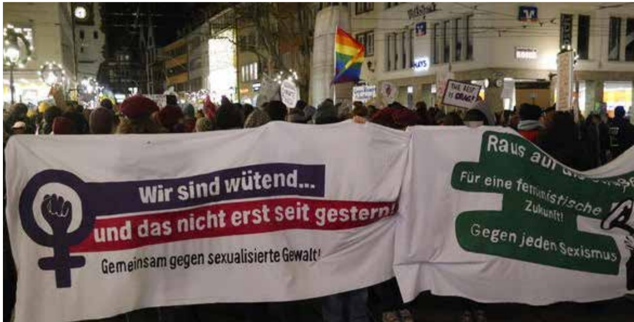
Feministische und antirassistische Demo gegen sexualisierte Gewalt 2018 in Freiburg (Foto: rdl.de, Lizenz: CC Attribution, non-Commercial, Share Alike)

Durch den Fokus der „Sicherheitspolitik“ und der dazugehörigen Debatte auf ‚fremde Männer‘ wird zudem ein Bedrohungsgefühl aufrechterhalten und verstärkt, das potentielle Unsicherheit von Frauen* verschärfen und sie somit aus dem öffentlichen Raum ausschließen kann.