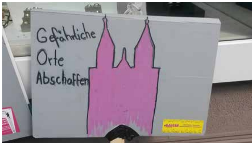
Demonstration gegen die Polizeigesetze in Freiburg

Sie sollten erstens zur Kenntnis nehmen, dass Kriminalität ein normales Phänomen ist, das in der räumlichen Betrachtung mit Urbanität einhergeht. Freiburg ist eine wachsende Großstadt, was sich notwendigerweise auch auf die Kriminalitätsbelastung auswirkt. Zweitens ist Kriminalität ein weiterer Oberbegriff, unter den verschiedenste Phänomene zusammengefasst werden. Es bedürfte einer