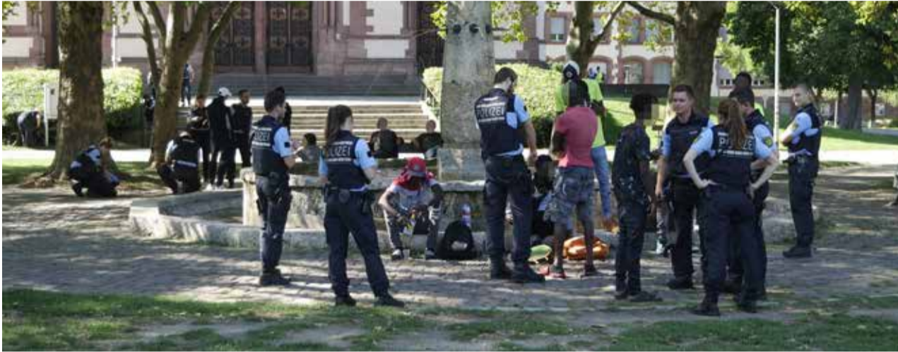
Polizeikontrolle Stühlinger Kirchplatz

nicht, dass die mich so sehen. Da habe ich mich geweigert. Sofort haben die vier Polizisten mich auf den Boden geworfen, ich hatte hinterher eine Platzwunde am Kopf, eine geprellte Schulter und mehrere blaue Flecken. Dann haben die Polizisten mich auf die Wache mitgenommen. Dort musste ich mich nackt ausziehen. So haben die mich mehr als eine halbe Stunde einfach so in einem Raum sitzen lassen. Währenddessen kamen immer wieder Polizisten ins Zimmer, die haben sich unterhalten, teilweise auch irgendwas gegessen. Ich bin herzkrank und habe ihnen das auch gesagt, ich habe einen Notfallausweis.