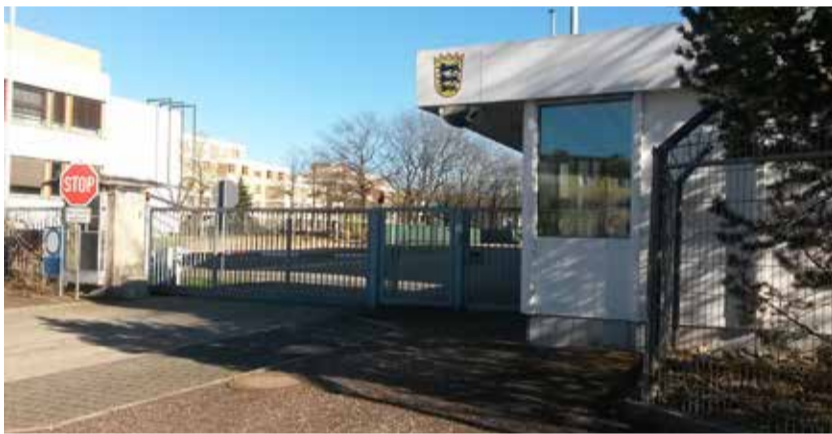
Eingang Landeserstaufnahmeeinrichtung Freiburg

Die Bewohner*innen der Einrichtung sind einer zentralen Autorität, dem Regierungspräsidium als Vertreter des Landes auf Bezirksebene, unterworfen. Die Anordnungen des Sicherheitsdienstes und des Dienstleisters für die Alltagsbe-