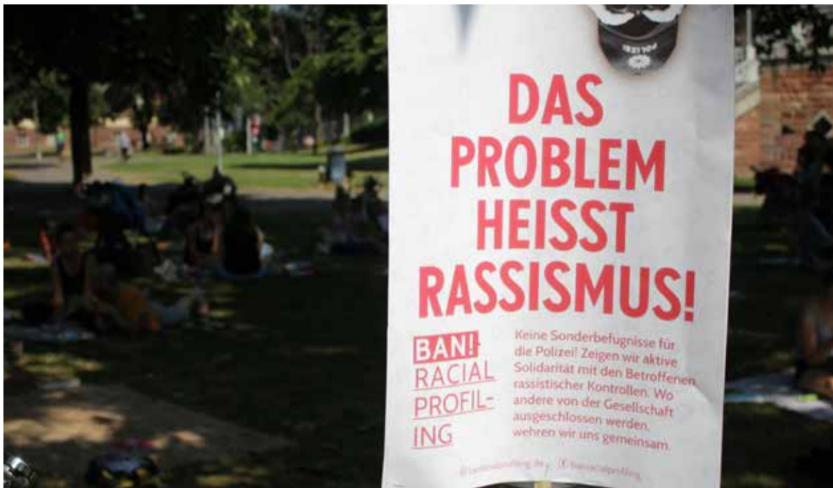
Plakat am Stühlinger Platz, (Foto: rdl.de, Lizenz: CC Attribution, non-Commercial, Share Alike)

Kontakt: Anwohnerinnen-Verein-Stühlinger@gmx.de